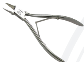
Кусачки для вросших ногтей