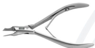
Кусачки для вросших ногтей