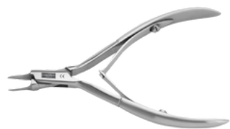
Кусачки для вросших ногтей