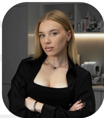
SMM и Event Менеджер