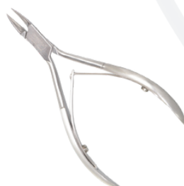
Кусачки для вросших ногтей длина 115 мм/кромка 13,5 мм