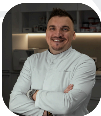
Директор компании и ведущий подолог