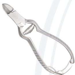
Кусачки для длины ногтей