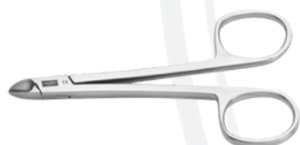
Накожницы (глазки) "DIABETIC"