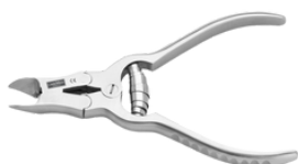
Кусачки для ногтей с передаточным отношением "DIABETIC"