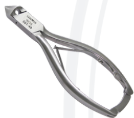
Кусачки с двухсторонней кромкой