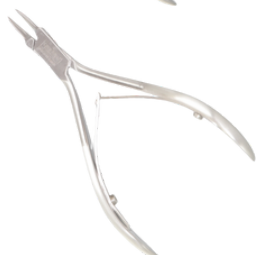
Кусачки для вросших ногтей длина 115 мм/кромка 15 мм