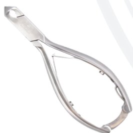
Кусачки для ногтей