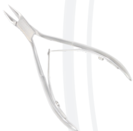
Кусачки для вросших ногтей длина 115 мм/кромка 16 мм