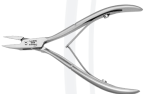
Угловые кусачки, для вросших ногтей Clauberg