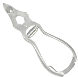
Кусачки для ногтей с передаточным отношением