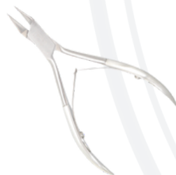
Кусачки для вросших ногтей длина 130 мм/кромка 17 мм