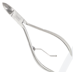
Кусачки для длины ногтей