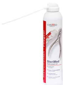
Масло для ухода за инструментами