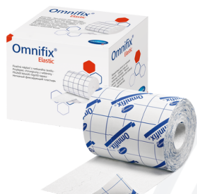
Эластичный фиксирующий пластырь