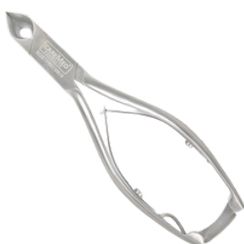
Кусачки для ногтей