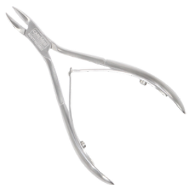
Кусачки для вросших ногтей длина 115 мм/кромка 15 мм